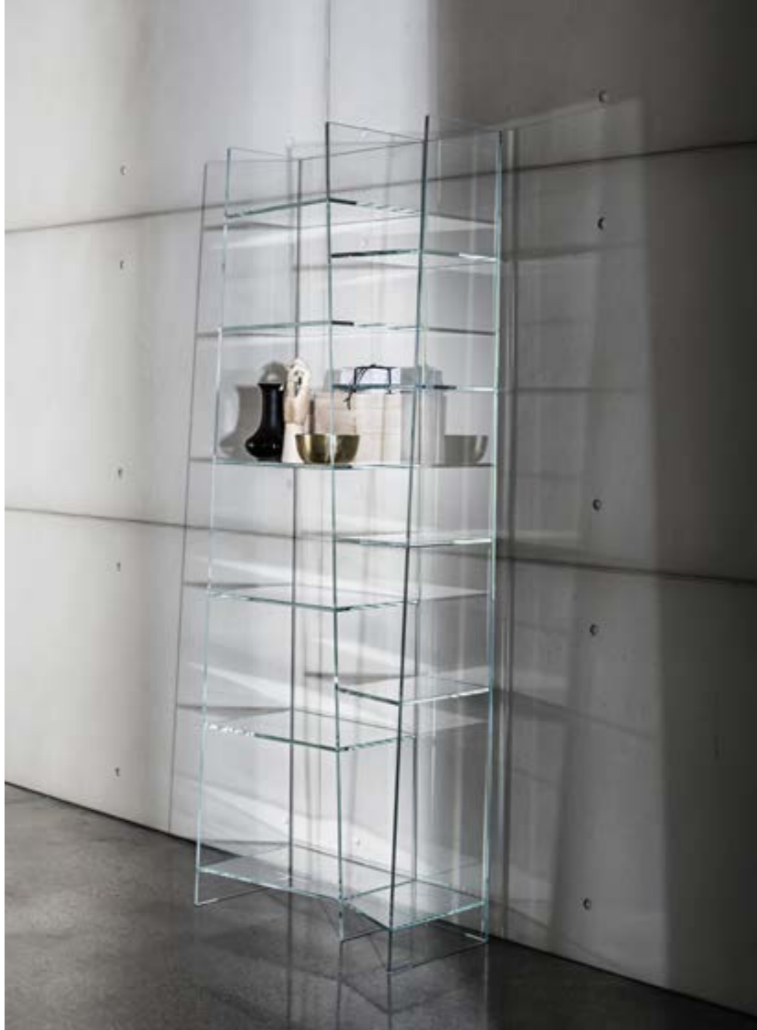
Delphi h190 TETE.