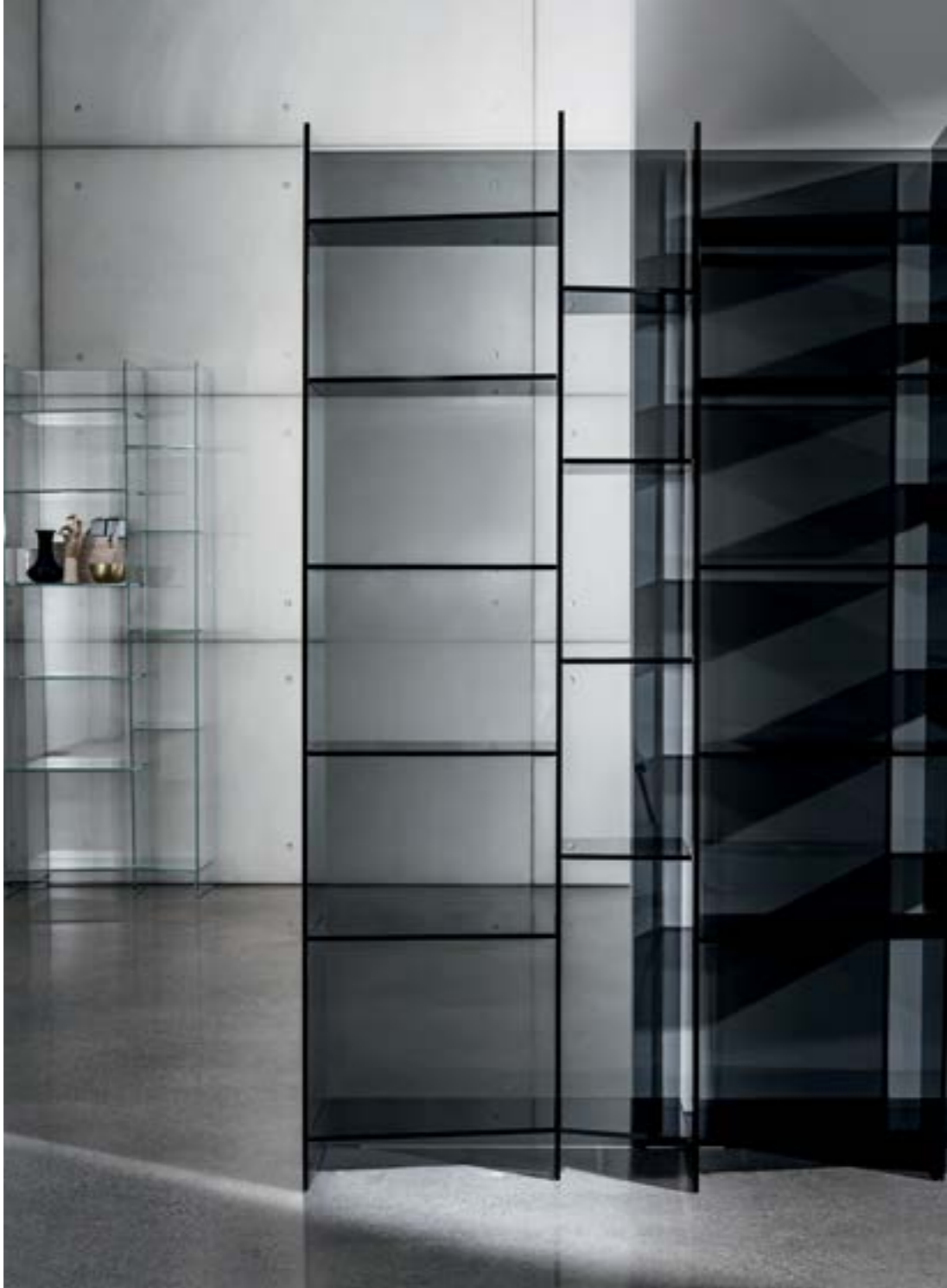
Delphi h190 TETE and TTF.