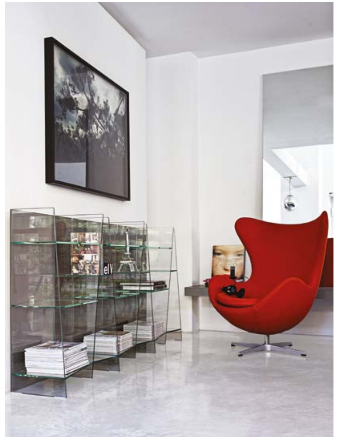
Delphi h96 TETE back TEC2.