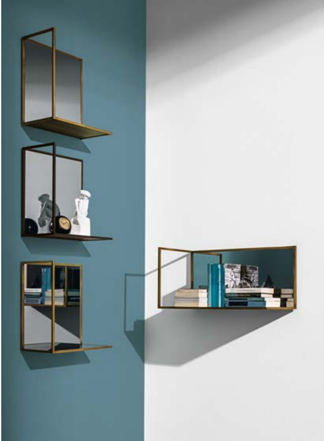
Visual mirror structure BR and SESP mirror. Bugatti armchair structure BR and 103 Hallingdal seat.