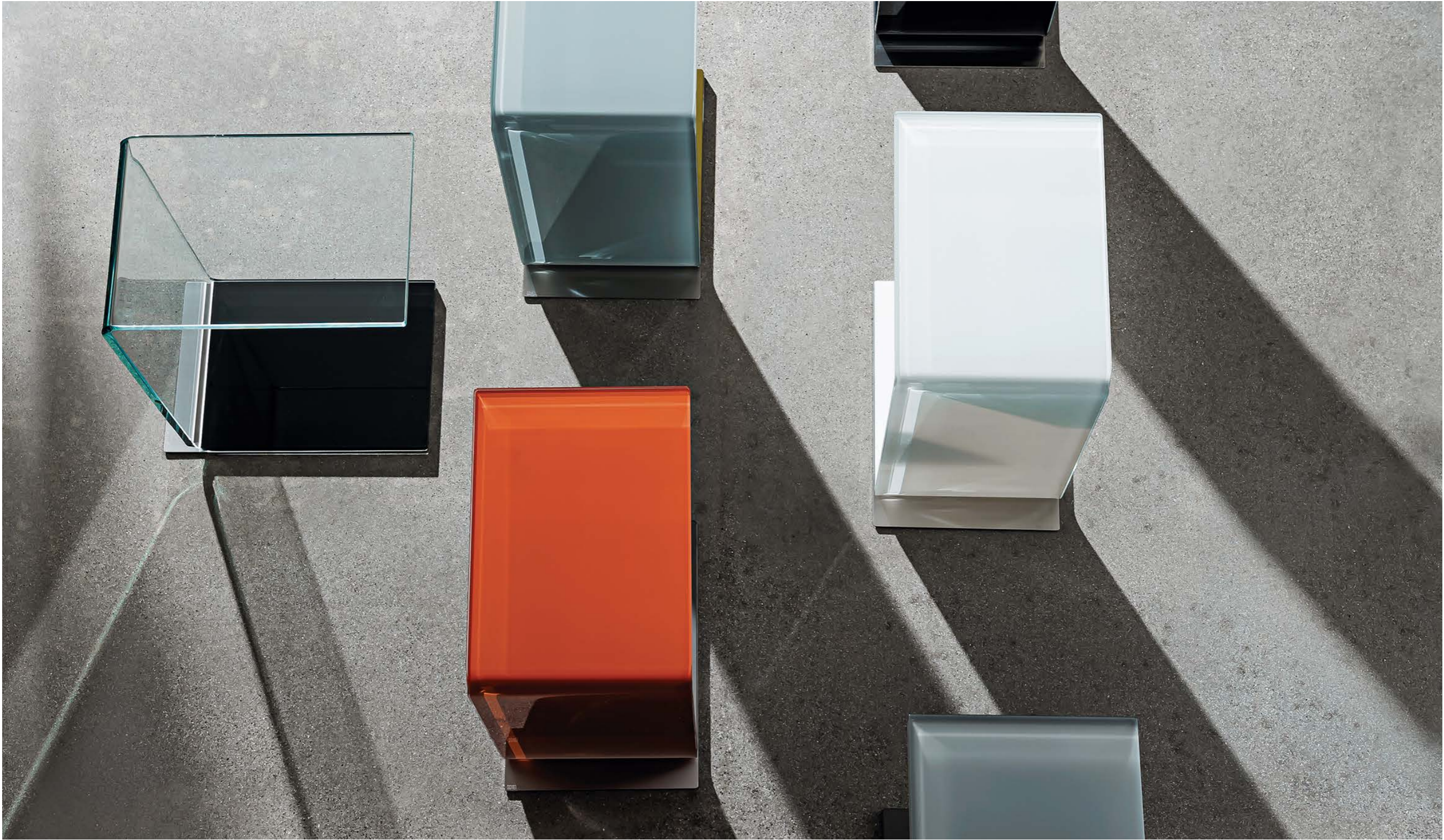
Swan TETE-TEN1, TER4, TEB1